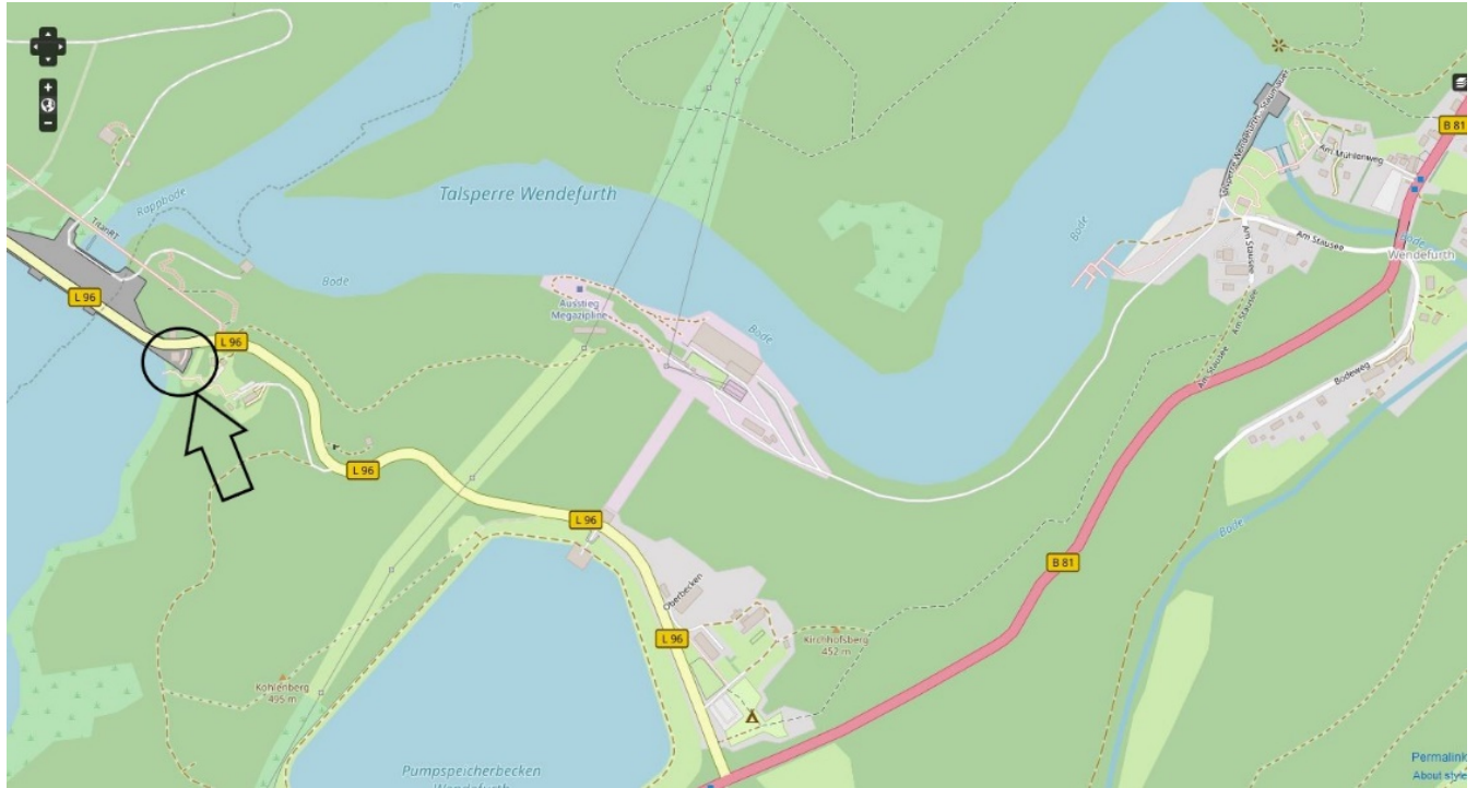
Anfahrt über Wendefurth